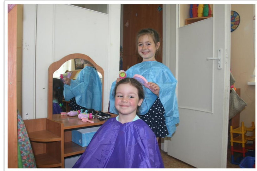
Новые пелеринки для парикмахерской сделаны из старых зонтиков