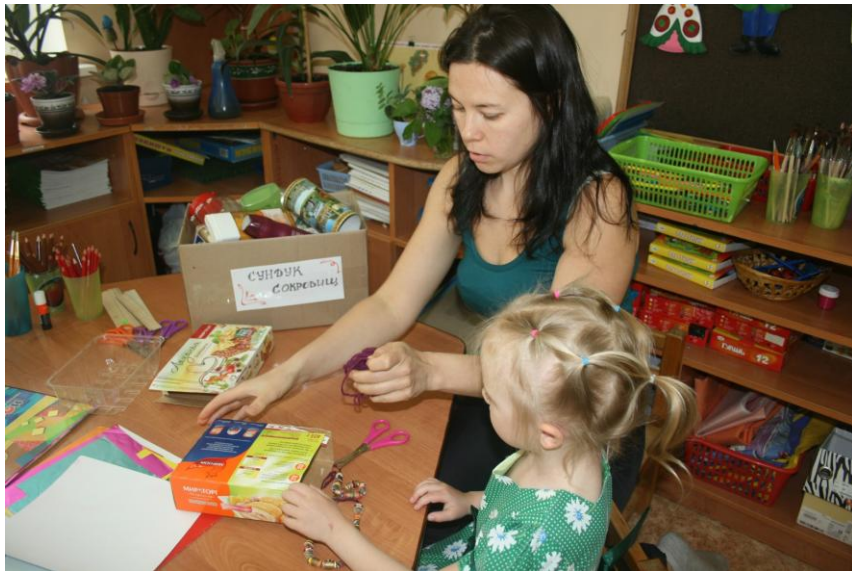
Мастер-класс «Очумелые ручки»