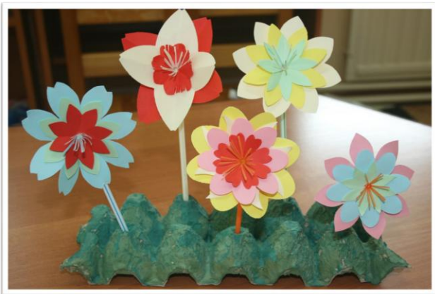
Из тары для яиц выросли цветы.