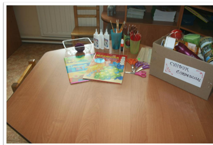
Мозговой штурм «С чем играть, если сломалась игрушка?»