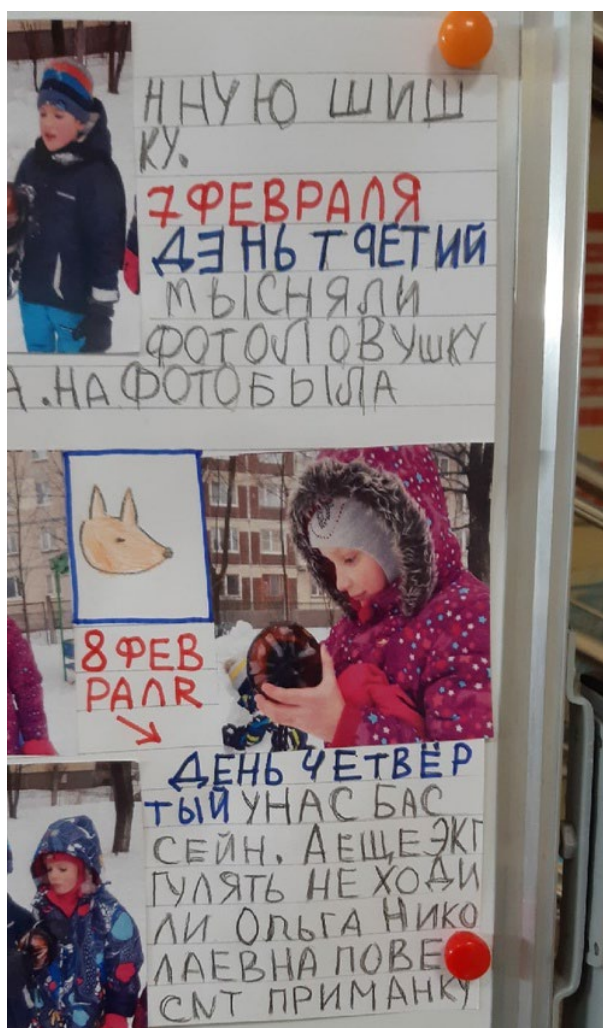
Ребята пробуют себя в роли корреспондентов газеты и готовят статью с фотографиями и рисунками.