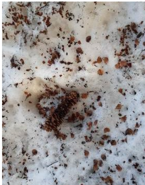
Нашли обгрызенную шишку. Предположили, что это белка лакомилась семенами ели.