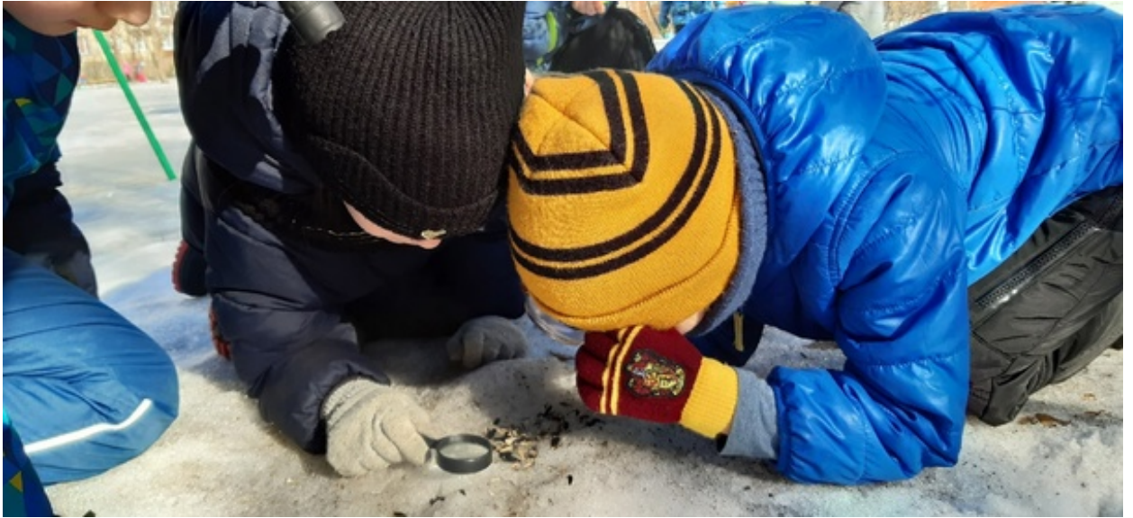
Сюжетно-ролевая игра «Учёные-зоологи ищут следы пребывания белки на участках детского сада»