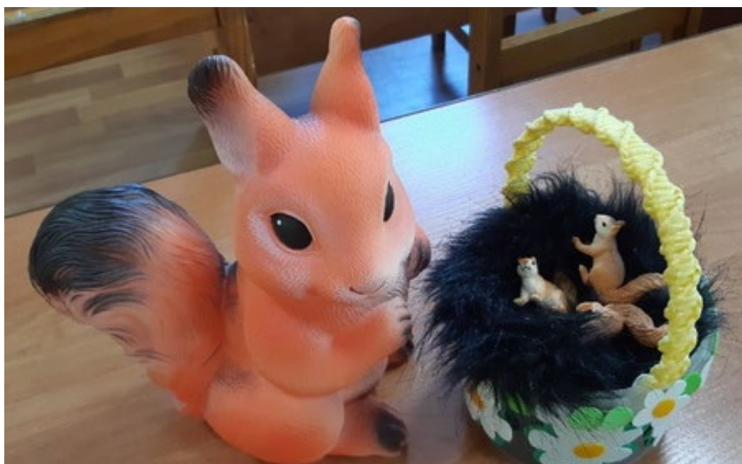
Луша знакомит бельчат с ребятами.