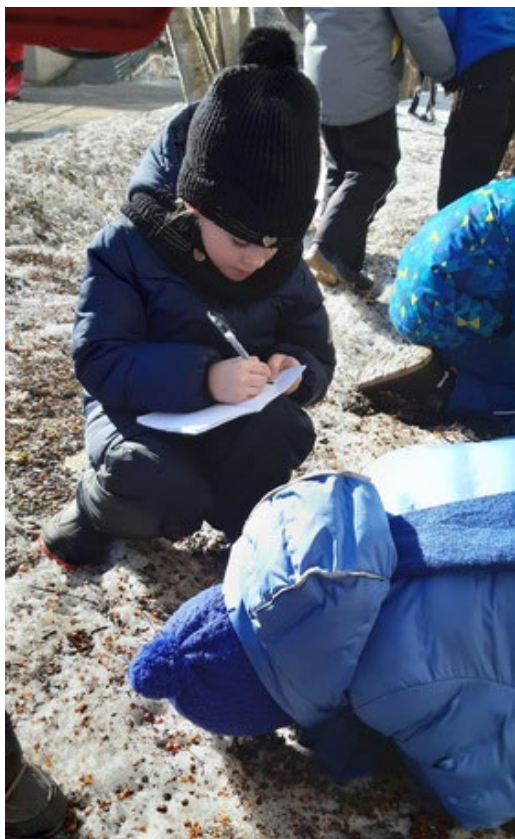
Фиксируем результаты поисков в Дневнике зоолога