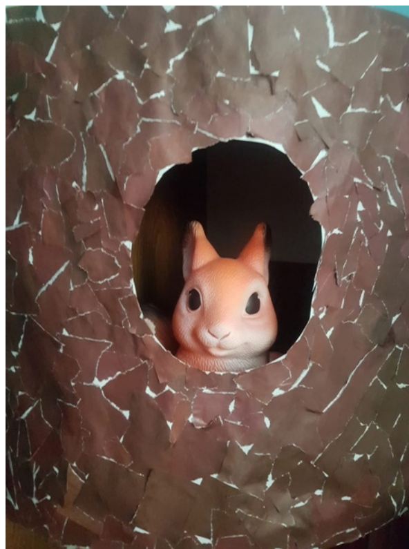
Белка в фокусе, то есть в дупле!