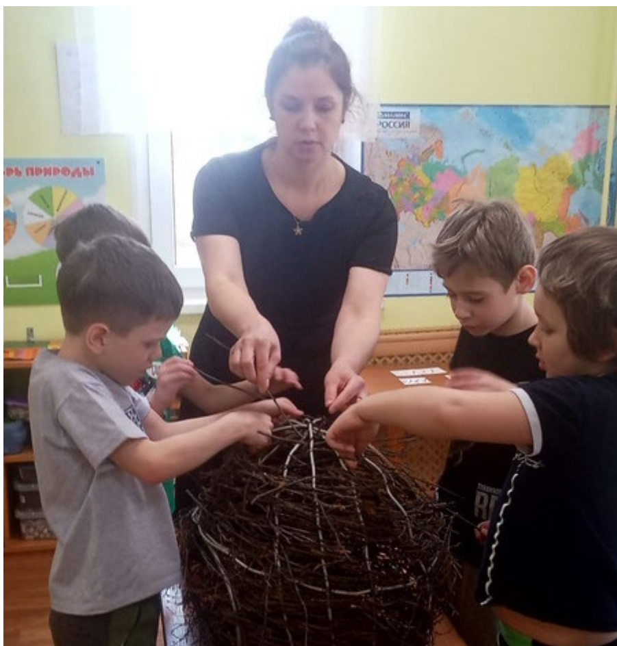
Открытое занятие по конструированию «Строим гайно для белки Луши»