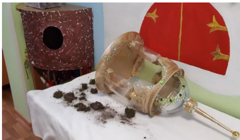
Игровая ситуация «Куница разрушила дупло»