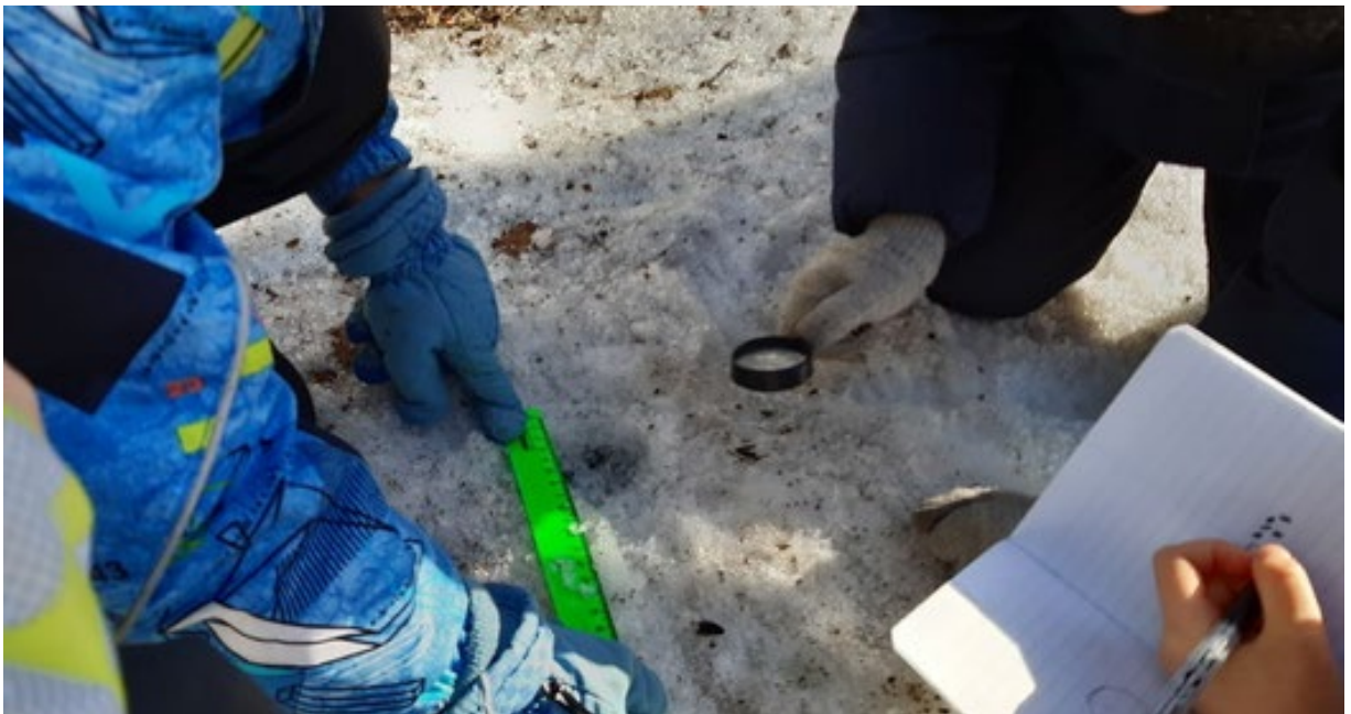
Зоологи обнаружили отчётливый след на снегу. Сделали замеры, выдвинули версию, что след кошачий.