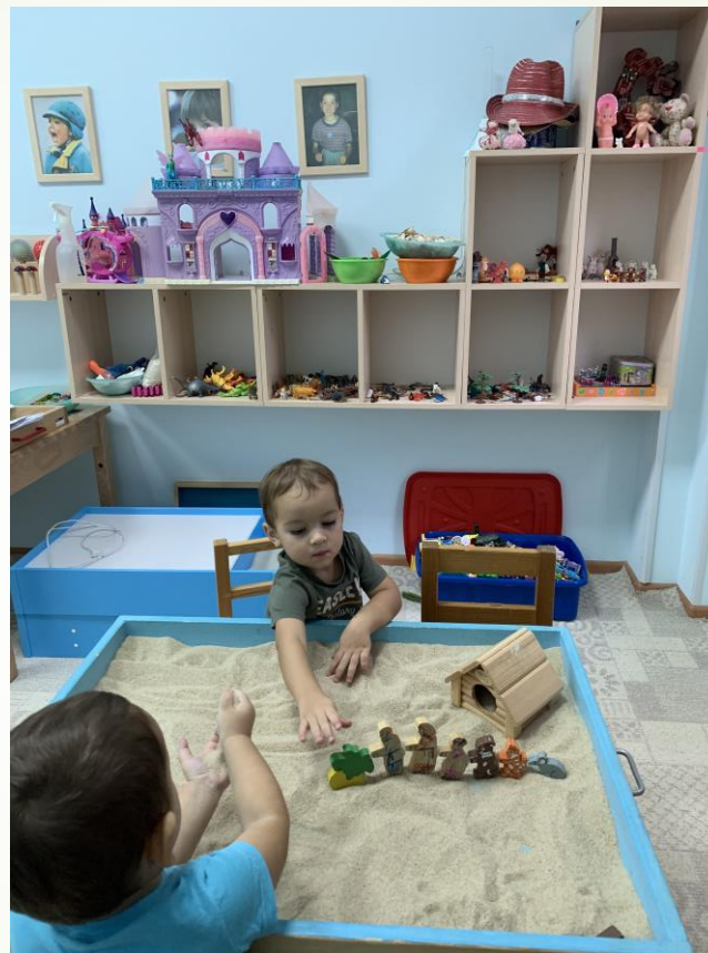
Сказка на песке «Репка»