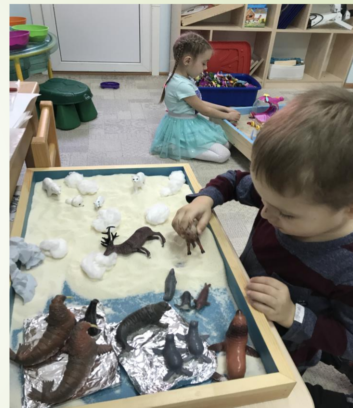
Лексическая тема «Обитатели Севера»