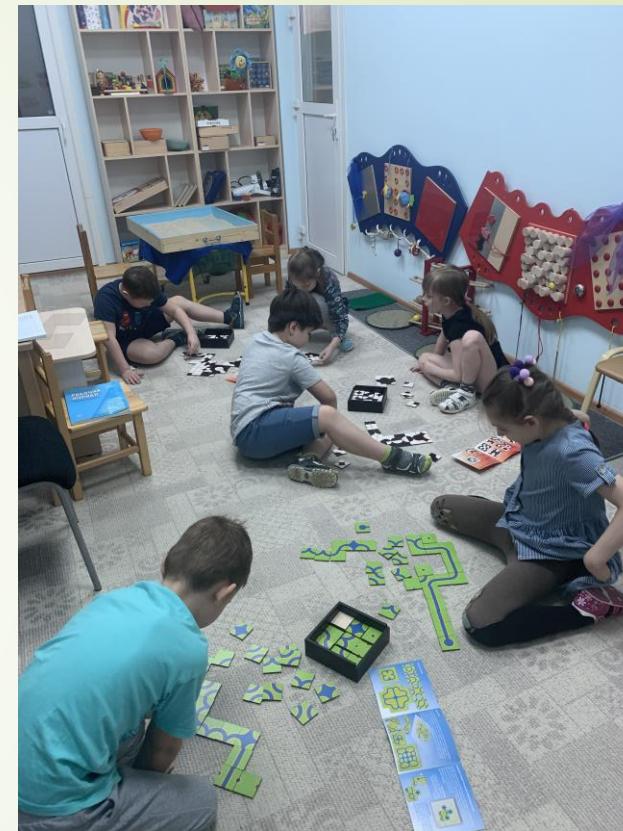
Игры «Каналетто», «Виколетто»