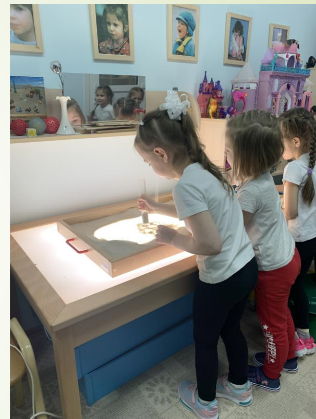
Рисуем стеклянной колбой «Удивление»