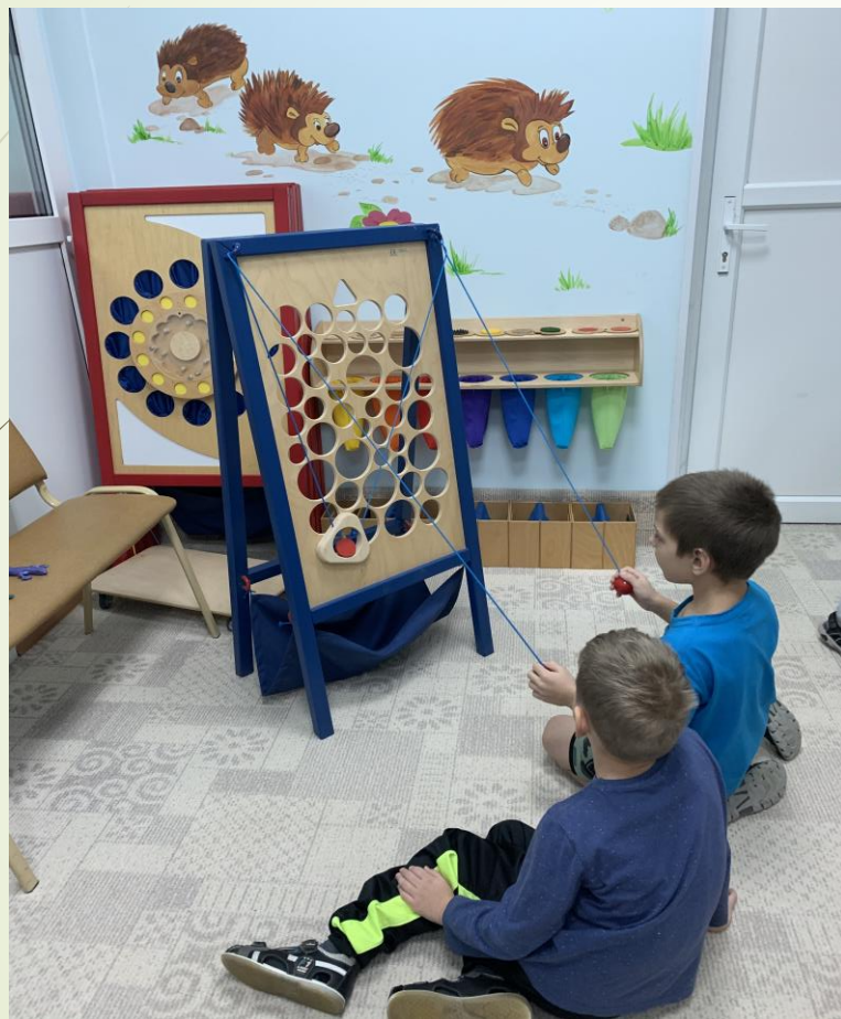
Игра «Сырный ломтик»

Игры, которые способствуют: развитию координации движений, развитию пространственной ориентации, внимания, зрительной и тактильной памяти, воссоздающего воображения, развитию навыков анализа своей деятельности