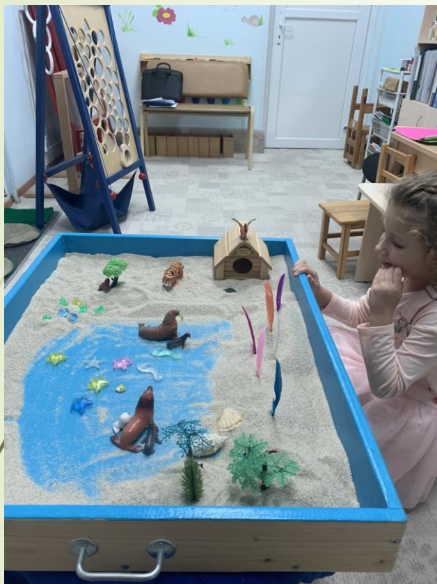
Песочная картина «Семья»