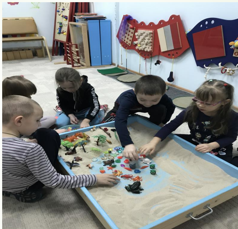
Лексическая тема «Обитатели водной стихии»