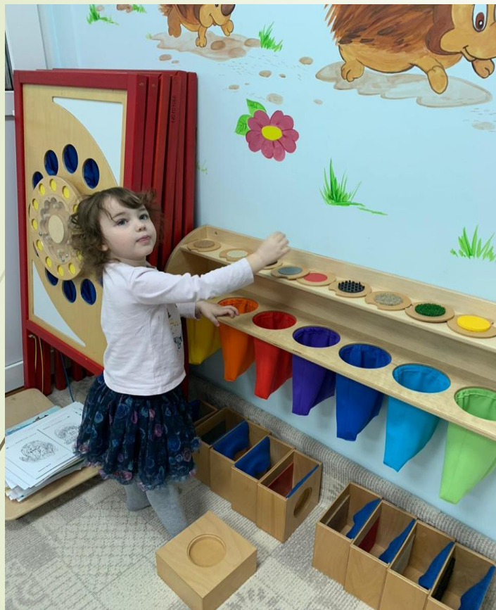
Пощупай рукой, определи ногой