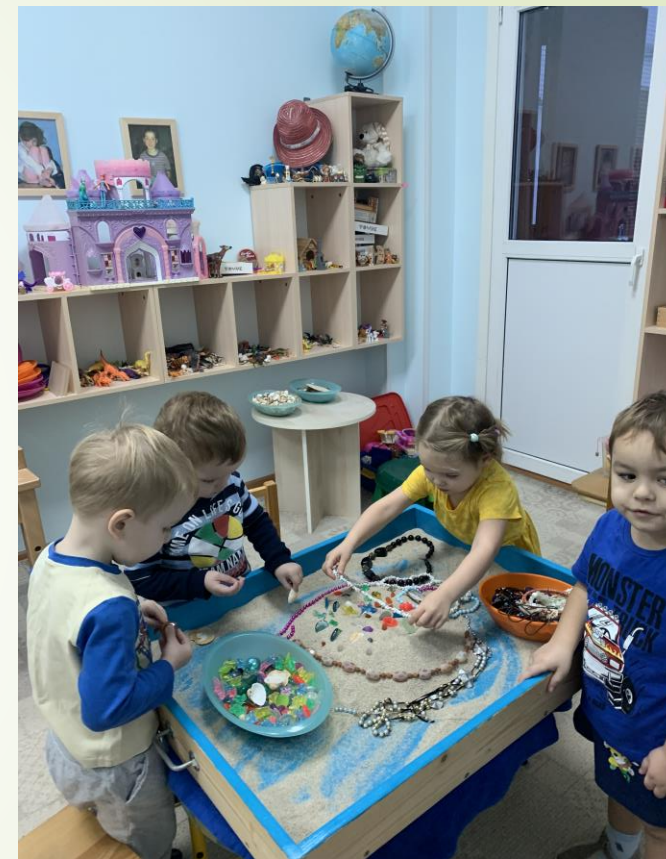
Упражнение «Песочный торт»