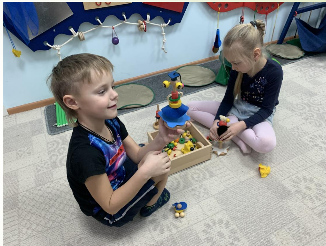
Игра «Семейка Джубиду»