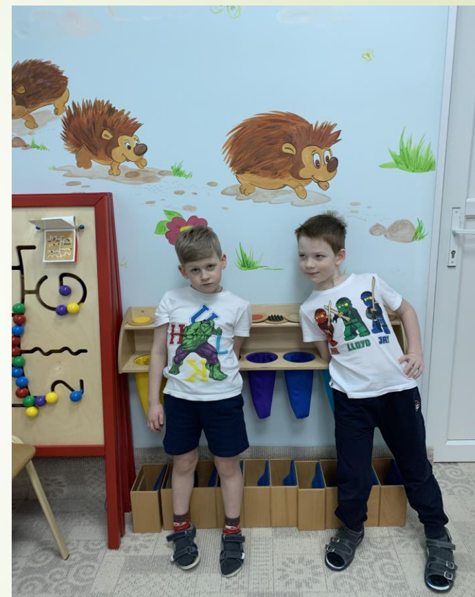
Настенный модуль с мешочками