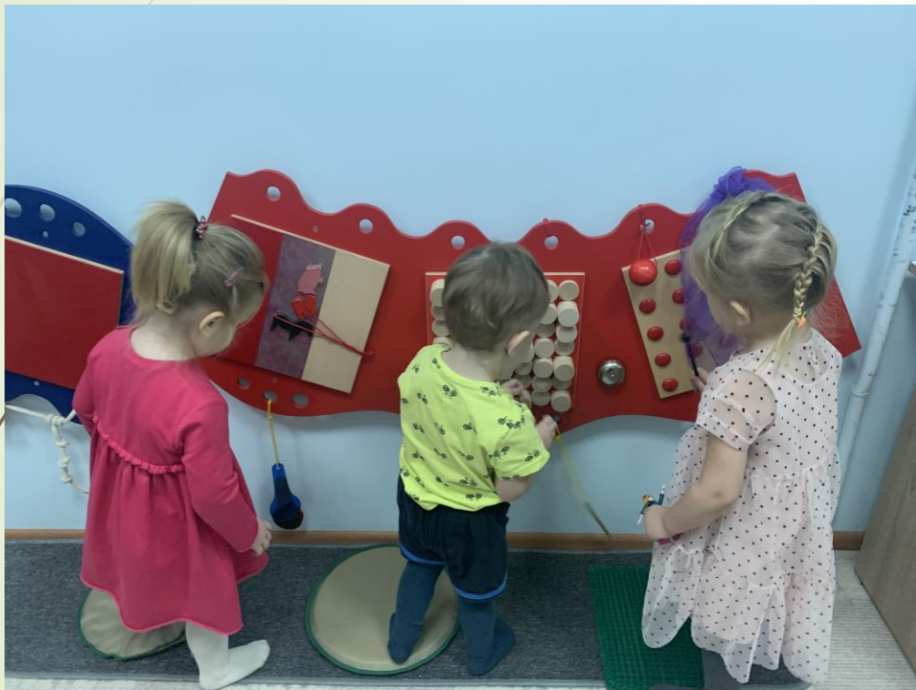
Настенная развивающая панель

«Что такое психомоторная комната»? Прежде всего это форма поддержки ребенка в стрессовых ситуациях, поэтому здесь так хорошо малышам